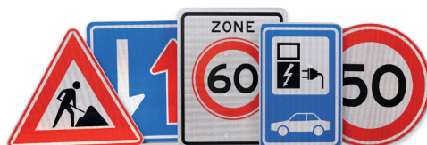
RVV Borden (Type I & II)